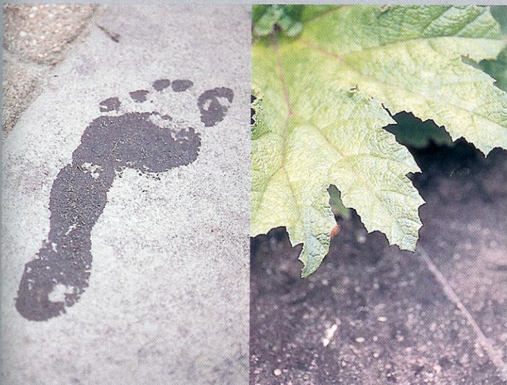
Natte voetafdrukken laten het hardsteen glanzen. Het grote lichtgroene Gunnerablade valt extra op naast het donkere steen.