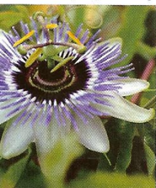
De bekendste winterharde passiebloem in Nederland is de passiflora caerulea .