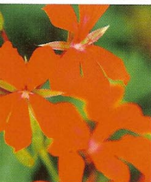
De tuingeranium, die in het Latijn eigenlijk pelargonium luidt, bloeit rijkelijk en lang.