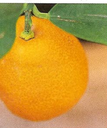
Kuipplanten zoals deze mandarijn ( citrus reticulata ) moeten overwinteren bij tien graden.