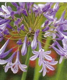
De Afrikaanse lelie ( agapanthus africanus ) is een als bol groeiende kuipplant.

geven ook rustige tuinen een uitbundige weelderigheid in de zomer.